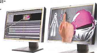
3D-Triks, l'outil de composition de la suite de 3DTV.